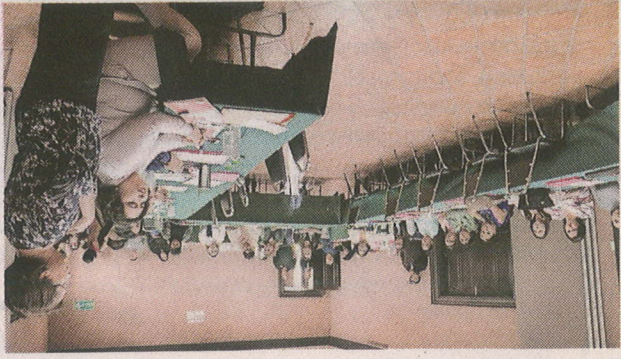
Juárez fue sede de las mesas de trabajo.

A este llamado también acudieron: Guadalupe, Apodaca, Monterrey, Cadereyta, Aguilaguas, China, Allende, Montemorelos, Pesquera, Zuzua, solo por citar algunos.